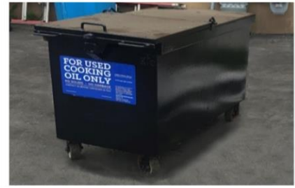
Giữ các thùng chứa dầu đã sử dụng sạch sẽ.