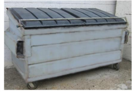
Luôn đóng kín nắp của thùng rác lớn.