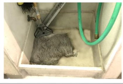
Đổ nước lau nhà vào bồn giặt chổi lau nhà.